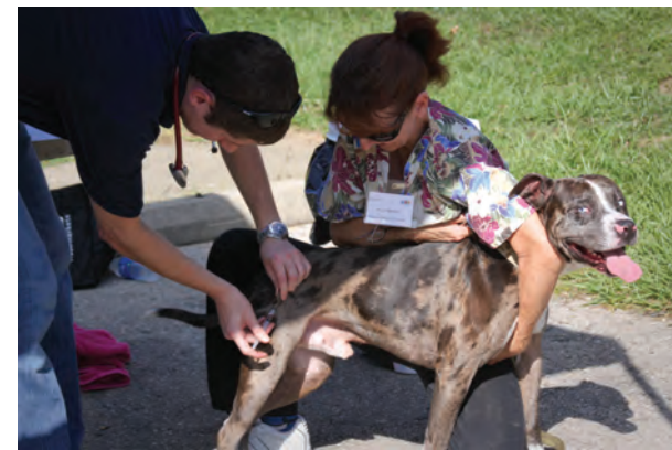
Séances de vaccination, États-Unis.

Grâce à nos partenaires, 10,000 cliniques vétérinaires ont reçu du matériel éducatif de la JMR. Les écoles vétérinaires du monde entier continuent à soutenir et participer à la JMR. Cette année, l'inauguration de la Semaine Vétérinaire annuelle de la Commission Européenne a coïncidé avec la Journée Mondiale de la Rage. La Commission a souligné l'importance de la JMR comme modèle de la méthode "One Health" et de plus, a encouragé la collaboration des organisations vétérinaires et médicales à travers l'Europe.