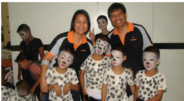
Célébration de la Journée Mondiale de la Rage, Bangkok, Thaïlande.

L'Association des nations de l'Asie du Sud-Est (ASEAN) a pris la résolution d'observer la Journée Mondiale de la Rage (JMR) tous les ans, et en Thaïlande la Journée a été marquée dans chacune des 76 provinces. De plus, pour la première fois, des événements ont été présentés en Iraq, en Afghanistan et en Palestine. Parmi l'assistance en nature que nous avons reçue cette année, il y a eu une donation anonyme de médicaments antirabiques d'importance vitale pour une valeur de plus de $250,000.