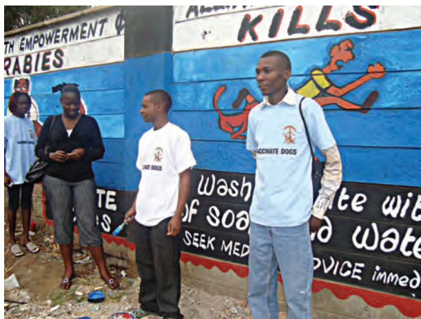
Educação comunitária: um mural na Quênia.