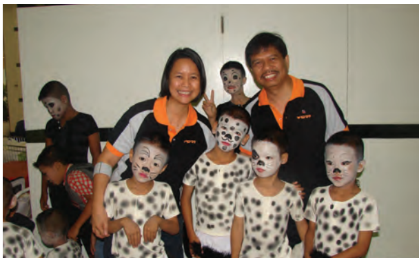
Celebração do Dia Mundial da Raiva em Bangkok, Tailândia.

A Associação das Nações do Sudeste Asiático (ASEAN) aprovou a celebração anual do Dia Mundial da Raiva. Na Tailândia, realizaram-se eventos em cada uma de suas 76 províncias. Além disso, pela primeira vez realizaram-se eventos no Iraque, Afeganistão e Palestina. Entre as doações em espécie que recebemos em 2009, houve uma doação anônima de medicamentos biológicos antirábicos ao Paquistão, no valor de $250.000,00, que salvará muitas vidas.