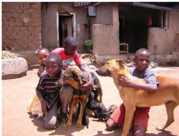
Crianças e cães durante a campanha de vacinação na Tanzânia

Graças ao apoio constante de nossos parceiros e voluntários, nossa iniciativa Dia Mundial da Raiva (DMR) continua obtendo êxito, facilitando a conscientização mediante educação e estimulando a reativação de programas de controle da Raiva a nível nacional no mundo inteiro. Necessitamos do seu apoio para que possamos continuar ajudando, educando e informando aos que correm maior risco de contrair a Raiva. Sugerimos que visitem nossa página na web para fazer uma doação para a campanha pelo Dia Mundial da Raiva 2010. Precisamos de sua ajuda para continuar conseguindo que a cada ano se salvem milhões de vidas humanas e animais.