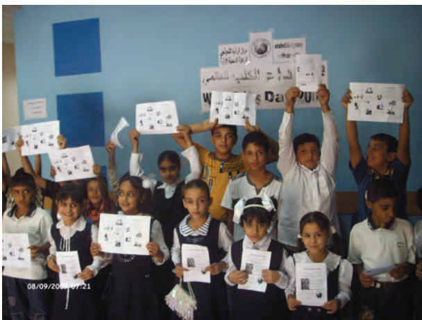
Educando crianças em uma escola do Iraque.